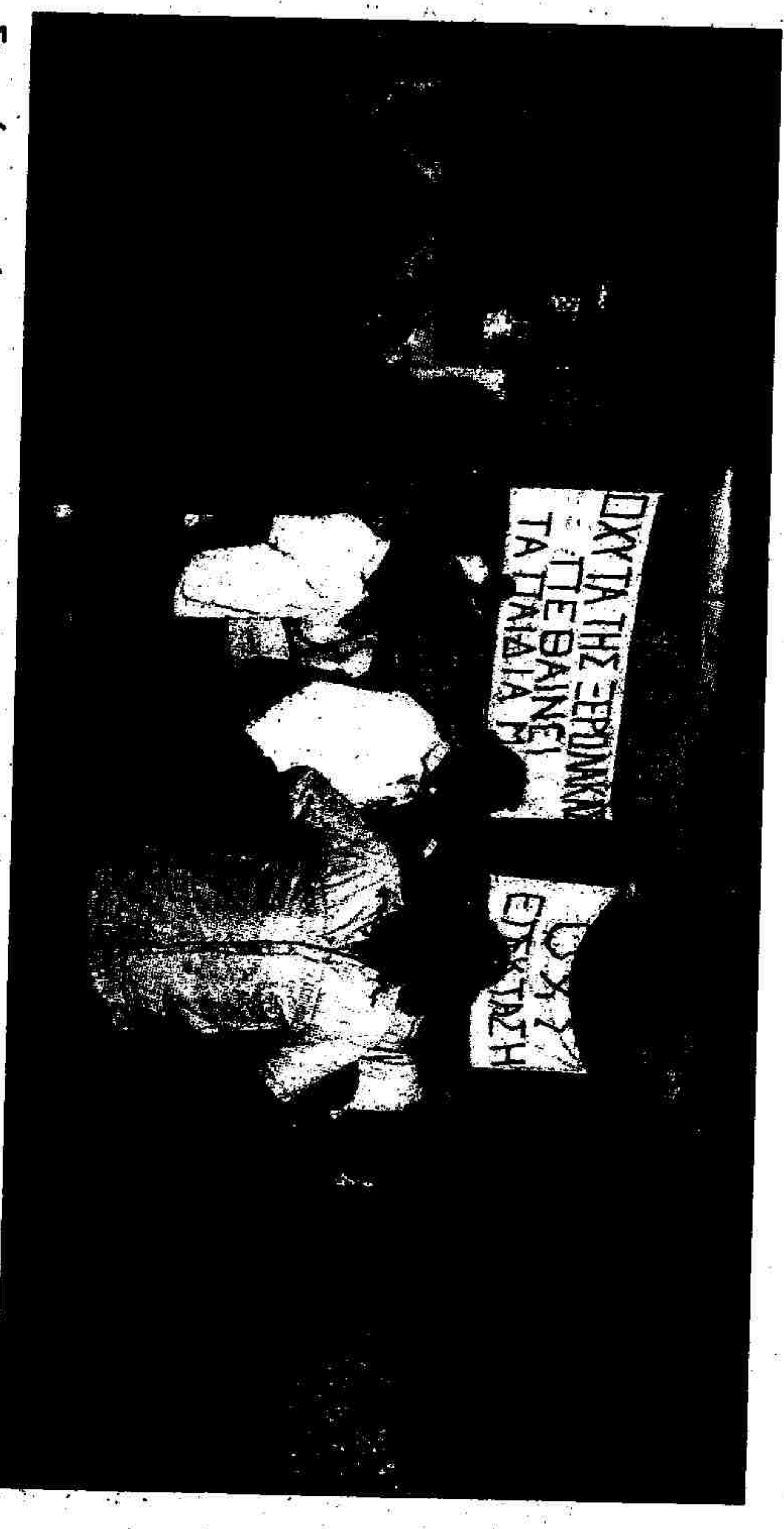
Στημιότυπο από την συγκέντρωση διαμαρτυρίας που πραγματοποιήσαν οι κάτοικοι

«Πόδες φορές έχετε καθήσει πάνω από το γκάτζι στο σπίτι σας; Κι όμως μας επιβάλλουν να αναπνεύσουμε μέρα νύχτα γκάτζι... αυτό είναι που μυρίζει γιατί αυτά που δεν μυρίζουν είναι τα πιο επικίνδυνα», σημείωσε το μέλος του ΣΥΛΛόγου Προστασίας Περιβάλλοντος Αρκτηκού Διαμερίσματος, Ήρα Κουρή.