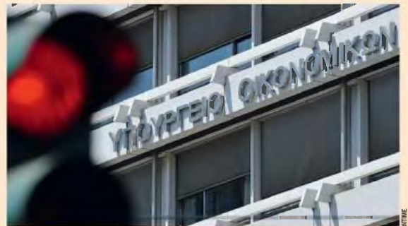
Η ιστορία των ρυθμίσεων χρεών ξεκινάει με την πρώτη περαιώση το 1978.

οφειλέτες ανέρχονται σε περίπου τέσσερα εκατομμύρια. Η τελευταία ρύθμιση εντάχθηκε στο πακέτο των μέτρων στήριξης για την αντιμετώπιση της νέας κρίσης που δημιουργεί ο πόλεμος στο Ιράν. Θα είναι 72 δόσεων, θα τεθεί σε εφαρμογή τον Ιούνιο και όπως όλα δείχνουν, θα μείνει ανοικτή έως τα τέλη του έτους. Σελ. 22