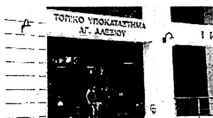
Η μονάδα Αγίου Αλεξίου έχει οδοντίατρος. Αλλά δεν φτάνει μία δομή για 300.000 Αχαιοίς

«θα έπρεπε στις δημόσιες δομές να υπάρχει δυνατότητα πρόσβασης ή αλλιώς, όπως γίνεται με όλες τις ιατρικές ειδικότητες να υπάρχουν κάποιες συμβάσεις, που θα καλύπτουν εάν όχι όλη την οδοντιατρική, κάποια βασικά πράγματα» τονίζει ο κ. Μουτούσης εφημερεύοντας. «Θα μπορούσε να υπάρχει μία μορφή σύμβασης, που θα κάλυπτε την αντιμετώπιση πόνου, το σφράγισμα κλπ. Να παρέχει δηλαδή τη βασική οδοντιατρική περίθαλψη. Αλλιώς σε ασφαλισμένους πληρώνουν για όλα αυτά. Οι ασφαλιστικές εισφορές είναι αρκετά υψηλές σε πολλούς κλάδους. Αυτό συμβαίνει μόνο στην Ελλάδα. Σε όλες τις χώρες της Δυτικής Ευρώπης παρέχεται στους πολίτες