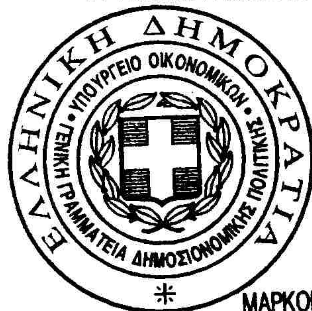
ΜΑΡΚΟΠΟΥΛΟΣ ΑΡΙΣΤΕΙΑ ΚΣ

ΑΚΡΙΒΕΣ ΑΝΤΙΓΡΑΦΟ Ο ΠΡΟΪΣΤΑΜΕΝΟΣ ΔΙΕΚΠ/ΣΗΣ ΑΥΤΟΤΕΛΟΥΣ ΓΡΑΦΕΙΟΥ ΓΡΑΜΜΑΤΕΙΑΣ ΚΑΙ ΑΡΧΕΙΟΥ Α/Α