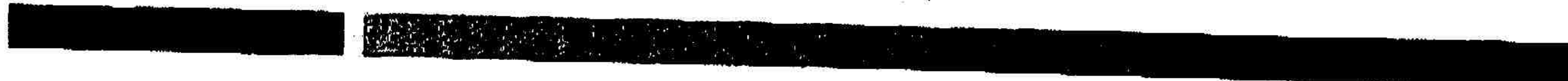
Ανδρέας Ταπραντζής Ευτεταλμένος Σύμβουλος