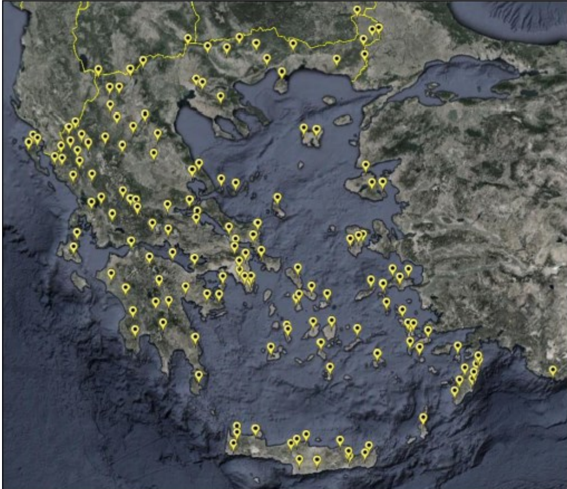
Εικόνα 1: Θέση εκπομπής 156 Κέντρων Εκπομπής

σύνολο της επικράτειας για την «Παροχή συμβουλευτικών υπηρεσιών για την ψηφιακή τηλεόραση προς το Υπουργείο Υποδομών Μεταφορών & Δικτύων».